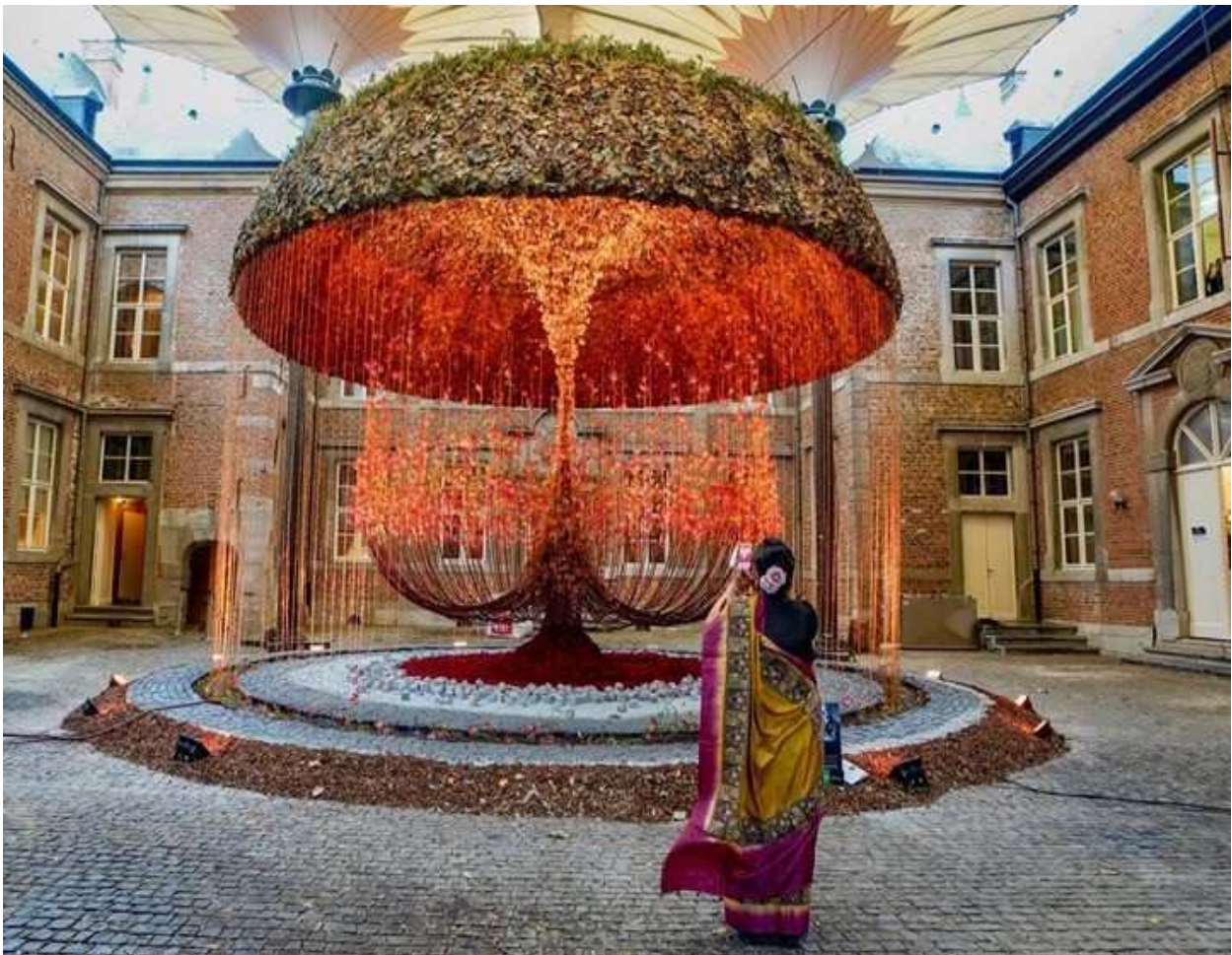
Fleuramour® 2018 – Commanderie d'Alden Biesen – Bilzen – Belgique – Création de Tom De Houwer